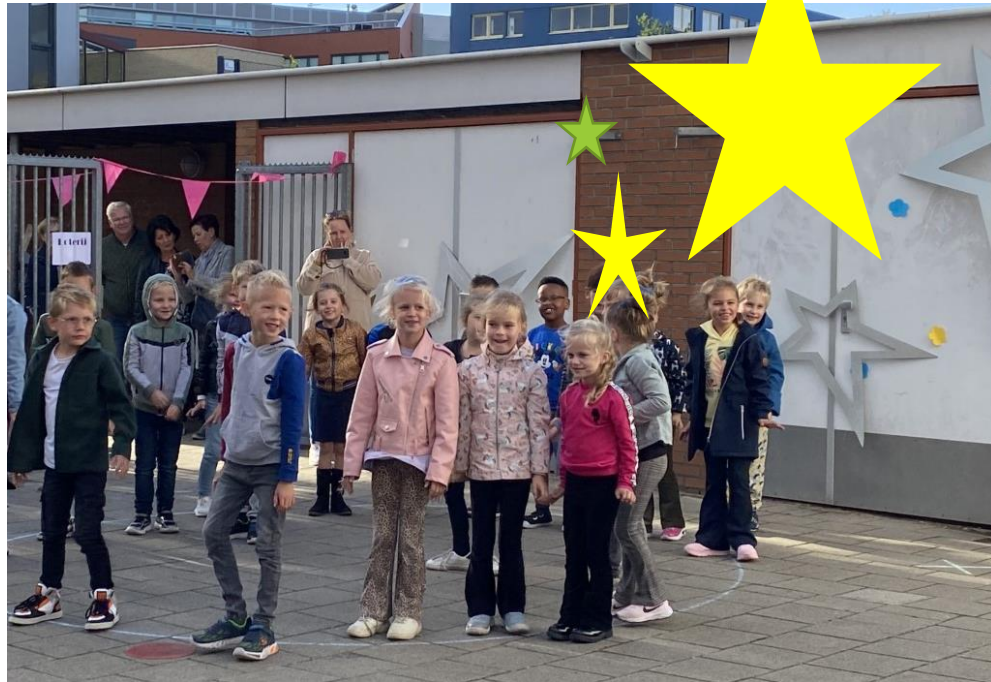
Foto pleinfest 2022, dans/toneel

Met talent bedoelen we dat kinderen in onze school mogen ontdekken waar hun belangstelling ligt, waar ze goed in zijn, waar ze affiniteit mee hebben. Wij geloven dat alle kinderen beschikken over talloze mogelijkheden en zien het als onze taak om daar ruimte voor vrij te maken.