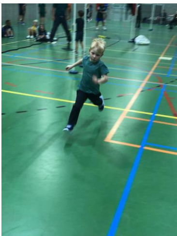
Foto: Sportdag thema Wonen, oktober 2022 WSV

Met verbondenheid bedoelen we dat alle mensen groot en klein voelen dat ze erbij horen. Dat we ons allemaal beseffen dat we elkaar nodig hebben en dat we van betekenis kunnen zijn voor elkaar. Een mooi voorbeeld is een sportdag met lokale sportverenigingen waar vrijwilligers de kinderen kennis laten maken met elkaar en sport.