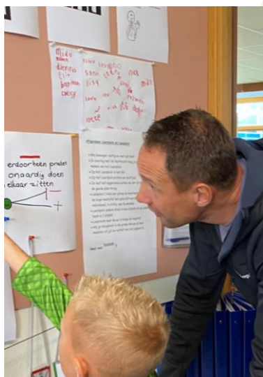
Foto 1 : Thema Wonen, leren vanuit betrokkenheid. Foto 2 & 3: Kijkmiddag, ouderbetrokkenheid.

Met exploratiedrang bedoelen we dat de aangeboren nieuwsgierigheid van kinderen naar de wereld om zich heen in tact willen houden. Daardoor ontstaat verbeeldingskracht en ondernemingszin.