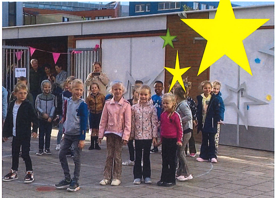
Foto pleinfest 2022, dans/toneel

Met talent bedoelen we dat kinderen in onze school mogen ontdekken waar hun belangstelling ligt, waar ze goed in zijn, waar ze affiniteit mee hebben. Wij geloven dat alle kinderen beschikken over talloze mogelijkheden en zien het als onze taak om daar ruimte voor vrij te maken.