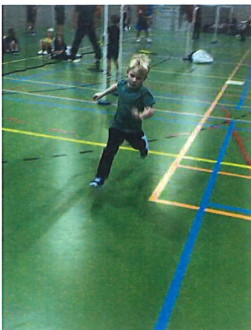
Foto: Sportdag thema Wonen, oktober 2022 WSV

Met verbondenheid bedoelen we dat alle mensen groot en klein voelen dat ze erbij horen. Dat we ons allemaal beseffen dat we elkaar nodig hebben en dat we van betekenis kunnen zijn voor elkaar. Een mooi voorbeeld is een sportdag met lokale sportverenigingen waar vrijwilligers de kinderen kennis laten maken met elkaar en sport.